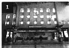
1 JR品川駅の改札を出て高輪口に進みます。