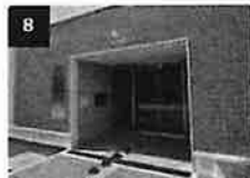
8 京急第11ビルの入り口から建物の入り口に入ります。