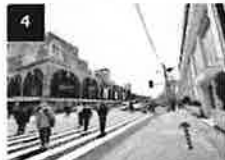
4 横断歩道を選った元の歩道を右（品川プリンス方面）に進みます。