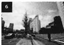
6 品川プリンスの駐車場を越えて更に歩道を直進します。