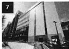
7 1Fが京急ストアのビルがTKPガーデンシティPREMIUM品川のあるビルです。建物の右側の道路を進みます。