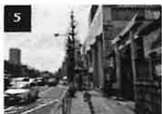
5 品川・高山稲荷神社を越えて更に歩道を直進します。