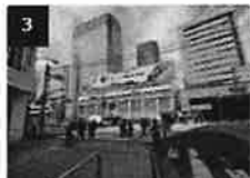
3 第一京浜の横断歩道を渡ります。