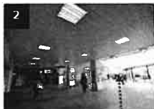
2 高輪口ロータリーの原島品川駅の改札方面に進みます。