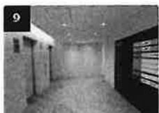
9 エレベーターで5F、6FのTKP会場まで進みます。

当日の遅刻や欠席または日程変更希望のご連絡は、TKPではなくご自身の所属企業の担当者様へご連絡ください。