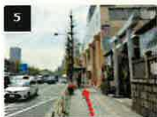
5 品川・東山崎交差点を超えて更に歩道を直進します。