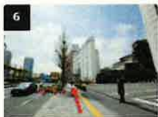
6 品川プリンスの踏切場を超えて更に歩道を直進します。