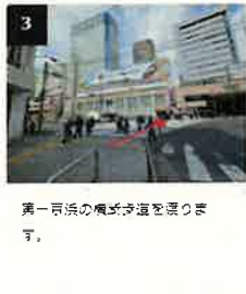
3 第一京浜の横断歩道を渡ります。