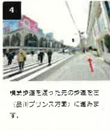
4 横断歩道を渡った元の歩道を右（品川プリンス方面）に進みます。