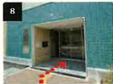
8 京急第11ビルの入り口から建物に入ります。