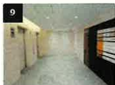
9 エレベーターで5F、6FのTKP会場までお越しください。

当日の遅刻や欠席または日程変更希望のご連絡は、TKPではなくご自身の所属企業の担当者様へご連絡ください。