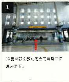
1 品川駅の改札を出て高輪口に進みます。