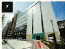
7 1Fが京急ストアのビルがTKPガーデンシティPREMIUM品川のあるビルです。建物の角の通路を進みます。