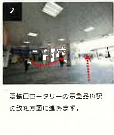
2 高輪口ロータリーの京急品川駅の改札方面に進みます。