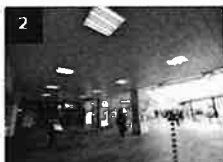
2 高輪口ロータリーの京急品川駅 の改札方面に進みます。