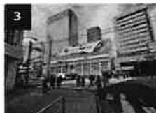
3 第一京浜の横断歩道を渡りま す。