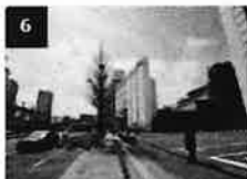
6 品川プリンスの駐車場を越えて 更に歩道を直進します。