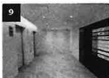
9 エレベーターで5F、6FのTKP会 場までお越しください。

当日の遅刻や欠席または日程変更希望のご連絡は、 TKPではなくご自身の所属企業の担当者様へご連絡ください。