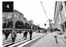
4 横断歩道を渡った先の歩道を左 （品川プリンス方面）に進みま す。