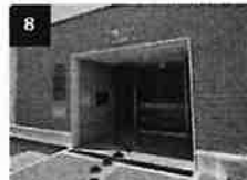
8 京急第11ビルの入り口から建物 に入ります。