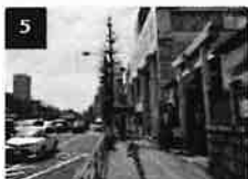
5 品川・高輪神社を越えて更 に歩道を直進します。