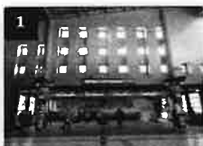
1 JR品川駅の改札を出て高輪口に 進みます。