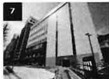
7 1Fが京急ストアのビルがTKPガ ーデンシティPREMIUM品川 のあるビルです。建物の右側の道路 を進みます。